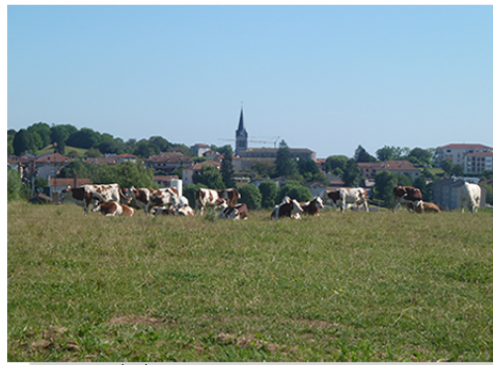
Vue sur Chalamont