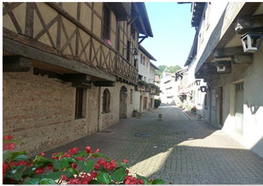
Rue des Halles