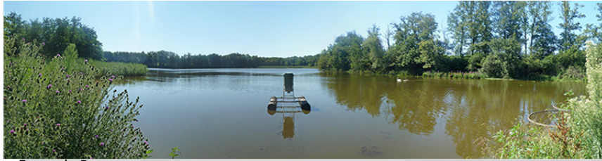
Etang de Pagneux