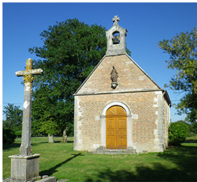
Chapelle de Ronzuel