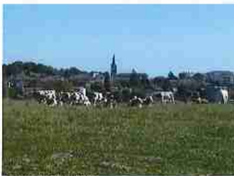
Vue sur Chalamont