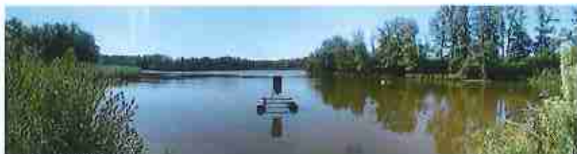
Frang de Pagneux

PLU prescrit le 12 juillet 2010 PLU arrêté le 11 juillet 2016 PLU approuvé le 6 Mars 2017