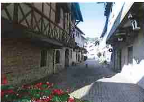
Rue des Halles