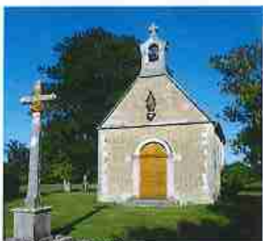
Chapelle de Ronzeu